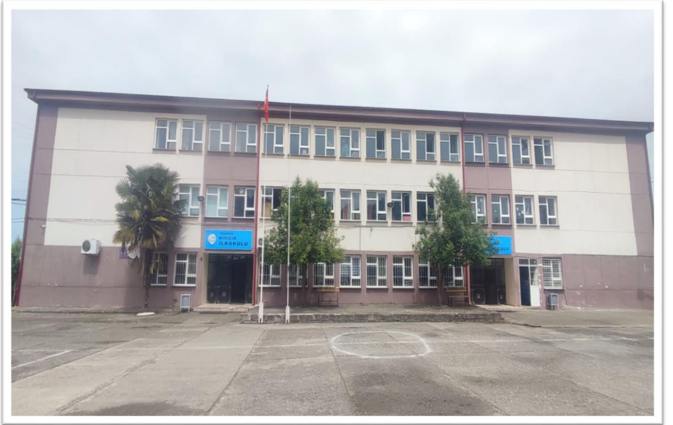
Tablo 1:Kurumun Künyesi